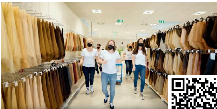
Voller Energie und Leidenschaft! Das Team von Great Lengths tanzt zu „Jerusalem“

Foto: Screenshot Youtube/Jerusalem – Great Lengths tanzt!